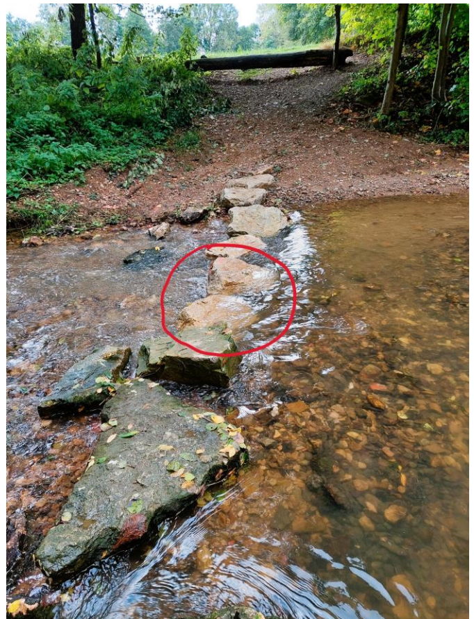
Tritte am Wehr in Drosendorf – schräg und überflutet – auch ohne Hochwasser.

Das Amt für Denkmalpflege wünschte sich hierbei lediglich, dass die Reste des alten Wehrs beim Bau eines Steges mitbenutzt werden. Dieser Vorgabe entsprechend wurde dann seitens der Gemeinde auch ein Planentwurf für einen Steg über das alte Wehr erstellt, der dann im Bauausschuss am 21.04.21 einstimmig gebilligt wurde. Auch in den darauffolgenden Haushaltsplanungen wurde dieses Projekt noch einmal diskutiert und mit folgendem Beschluss versehen: „Der Gemeinderat befürwortet den Bau einer Querungshilfe über den Leitenbach am östlichen Ortsrand von Drosendorf im Planungszeitraum 2021 – 2024.“, wobei die bereits veranschlagten Mittel in der Finanzplanung 2022 in Höhe von 75.000 € zu belassen sind.